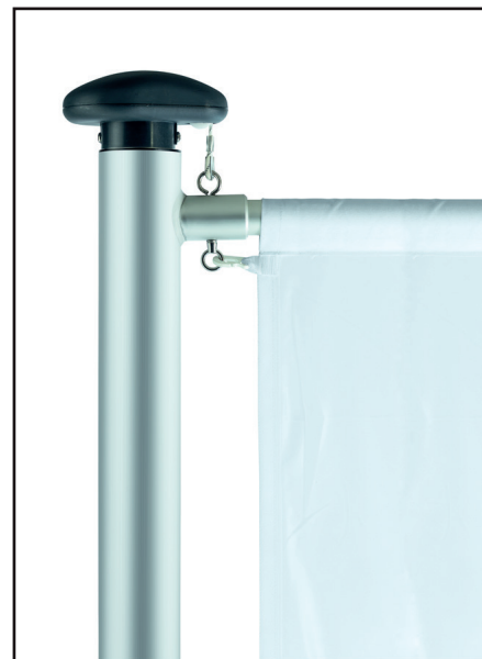
Mastkopf - mit Drehausleger