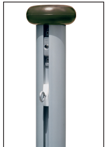
Mastkopf (Standard in anthrazit)